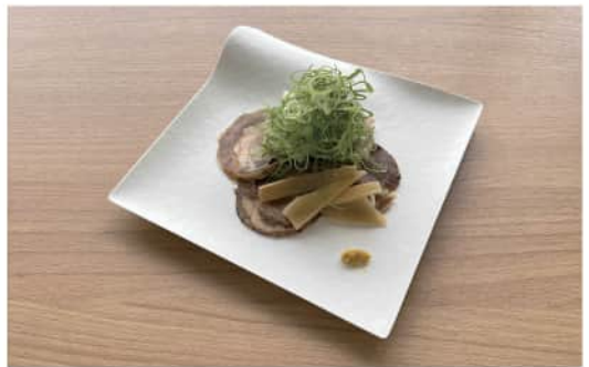
チャーシューの九条ねぎまみれ Charshu with Kyoto Green Onions ¥ 600