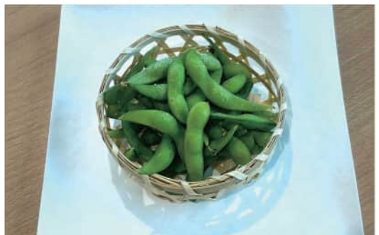
枝豆 Edamame ¥ 500