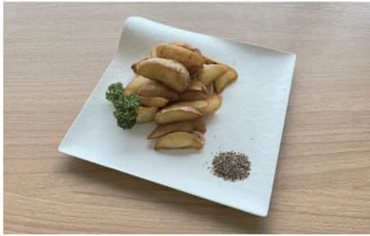
フライドポテト 燻製塩添え French Fries with Smoked Salt ¥ 500