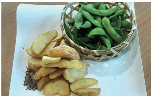
枝豆とポテトフライ盛合せ Edamame & French Fries ¥ 700