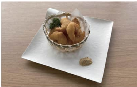
海老の天ぷら 柚子塩添え Shrimp Tempura with Yuzu Salt ¥ 700