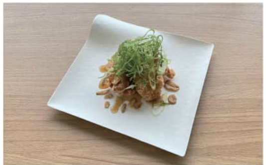
鶏の唐揚げ ガーリック風味 Garlic-flavored Fried Chicken ¥ 700