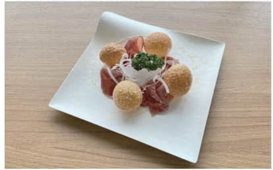
生ハムとパニプリパパド Prosciutto with Pani Puri Papad ¥ 700