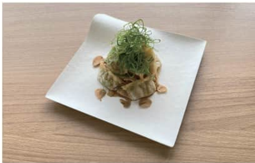
揚げ餃子の油淋鶏風 Fried Dumplings with Yurinchi Sauce ¥ 600